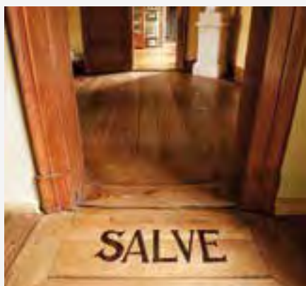
Eingangsbereich des Wohnhauses; © Klassik Stiftung Weimar Fotograf: Jens Hauspurg