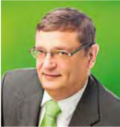
Rüdiger Eisenbrand Bürgermeister Apolda