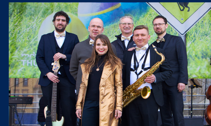
Golden Mary Band